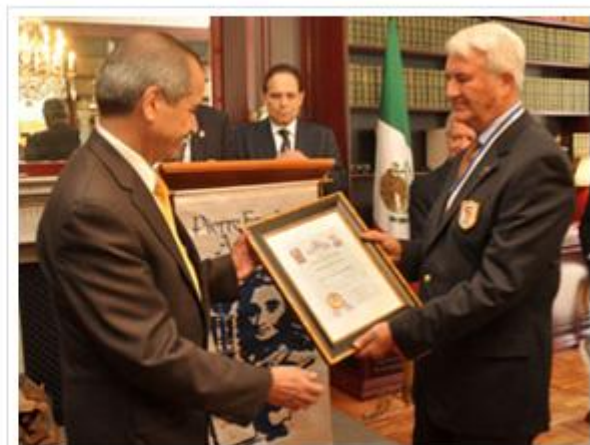
El ex secretario de Salud federal fue reconocido por la Academia Piere Fauchard.

Esto también ocurrió en el marco de los 75 años de vinculación profesional entre profesionales de la odontología de ambos países.